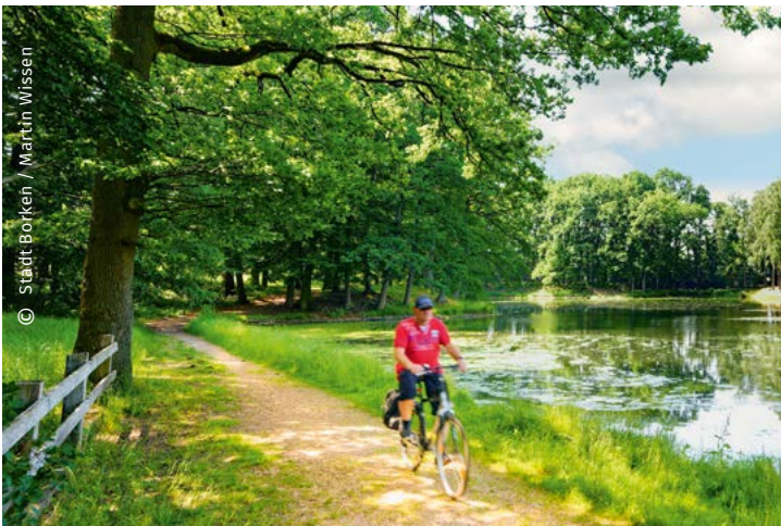
Durch die Stadt entlang des Flusses raus aufs Land