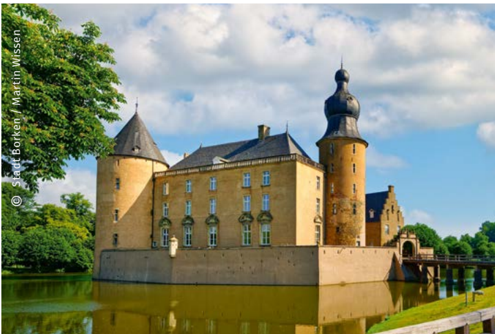
Burgen und Natur, Heimathaus, Bockwindmühle und Schaugarten